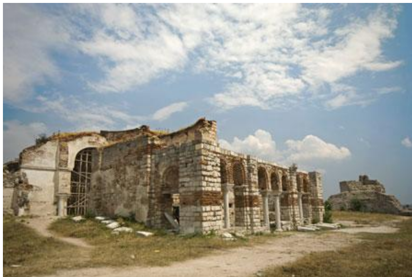
*Ερείπια στην Αίνο

Η πολεμική κατά του Δεδέαγατς, δεν σταμάτησε. Μήνες μετά, στην ίδια εφημερίδα στις 28 Οκτωβρίου 1872 υπάρχει ένα κείμενο με τίτλο «Εκδρομή εις Φέρρας και Δεδέαγατς» . Είναι ανυπόγραφο, αλλά αυτός που το έγραψε εξηγεί, ότι βρέθηκε στις Φέρρες που απέχουν από την Αίνο τέσσερις ώρες περίπου, λόγω σοβαρών εμπορικών του υποθέσεων. Μετά πήγε για δύο μέρες στο Δεδέαγατς, αλλά εκεί δεν βρήκε τίποτα, που να δικαιολογεί την κατασκευή του λιμανιού.