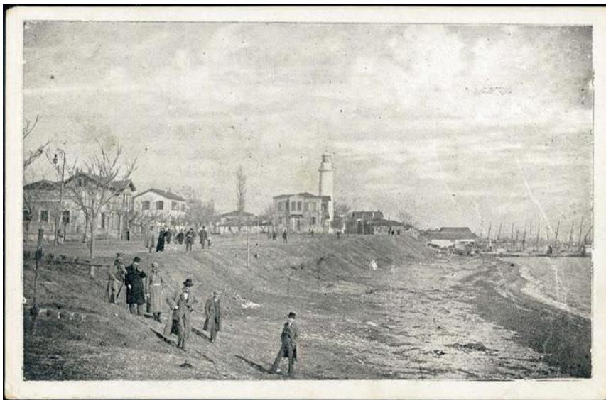
*Η παραλία της Αλεξανδρούπολης στις αρχές του 20ου αιώνα

Στο δημοσίευμα αυτό, το Δεδέαγατς περιγράφεται με μαύρα χρώματα ως «αλίμενο» και «άξενο» (γιαμπάν γιέρ, γράφει η εφημερίδα) δηλαδή αφιλόξενο, ως εκτεθειμένο στους νότιους ανέμους, μη έχον πόσιμο νερό, αλλά και ως περιοχή ελώδης με νοσηρό κλίμα και τους ολίγους κατοίκους του, που δεν ήταν και όλοι μόνιμοι, να υποφέρουν από ασθένειες. «Κάτωχροι και σπληνιώντες» χαρακτηρίζονται. Η περιγραφή αυτή ιατρικώς συμπίπτει με τα συμπτώματα της ελονοσίας. Όποιος προσβληθεί από ελονοσία πράγματι γίνεται κάτωχρος και διογκώνεται η σπλήνα του.