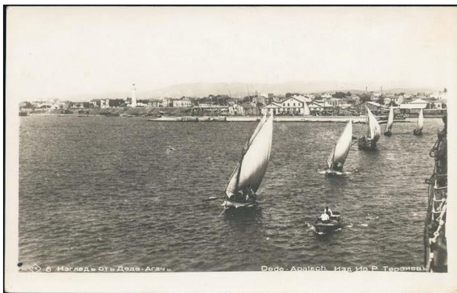
*Το Δεδέαγατς, η σημερινή Αλεξανδρούπολη σε μεταγενέστερη φωτογραφία

«Πόλις παράλιος κειμένη εις την αριστεράν όχθην και παρά τας εκβολάς του Έβρου. Αρχαιοτάτη μνημονευομένη και παρ' Ομήρου εν τοις στοιχείοις Β' και Δ' της Ιλιάδος. Προ της συστάσεως του Δεδέαγατς ήτο η αποθήκη του εμπορίου της Νοτιοδυτικής Θράκης από Παζαρτζηκίου και των λοιπών μερών μέχρις Αίνου και ενεργείτο ευρύ εμπόριον εξαγωγής σιτηρών. Διότι εφορτώνοντο ετησίως 3-4 πολλάκις δε και 5 εκατομμύρια κοιλιά Κωνσταντινουπόλεως. Προ 40-50 ετών ηρίθμει υπέρ τας δύο χιλιάδας οικίας. Νυν δεν μόλις αριθμεί 800-900 ων αι 100-130 εισίν οθωμανικαί αι δε λοιπαί ελληνικαί. Έχει σχολεία καλώς συντηρούμενα δια κληροδοτημάτων, οία Ελλ. Σχολήν, Δημοτικήν, Παρθεναγωγείον, εφέτος δε εσυστήθη Νηπιαγωγείον».