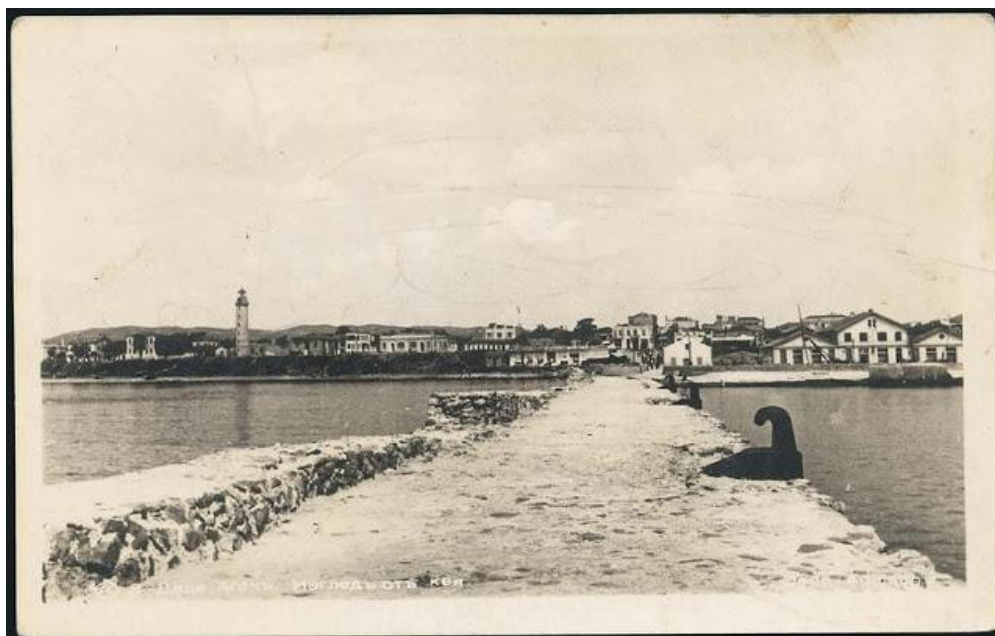
*Η παραλία της Αλεξανδρούπολης

Από το άρθρο αυτό προκύπτει, ότι από τότε που τέθηκε το ζήτημα της κατασκευής λιμανιού στο Δεδέαγατς ως συνέπεια της ανάπτυξης των σιδηροδρόμων οι Αινίτες με πολλές αναφορές τους προς την Οθωμανική κυβέρνηση προσπάθησαν να αποδείξουν ότι η εκλογή του Δεδέαγατς ήταν άσκοπη, επικίνδυνη και αντιοικονομική. Ενώ με την επισκευή του δικού τους λιμανιού, που δεν θα κόστιζε όπως έγραφε ο αρθρογράφος ούτε το τεσσαρακοστό της όλης δαπάνης, θα μπορούσε να λειτουργήσει με πολλά πλεονεκτήματα το φυσικό λιμάνι της Αίνου.