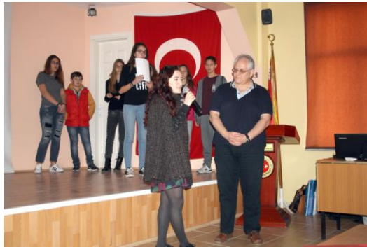
Η ομάδα παρουσίασης του 1 ου Γυμνασίου Χαλανδρίου