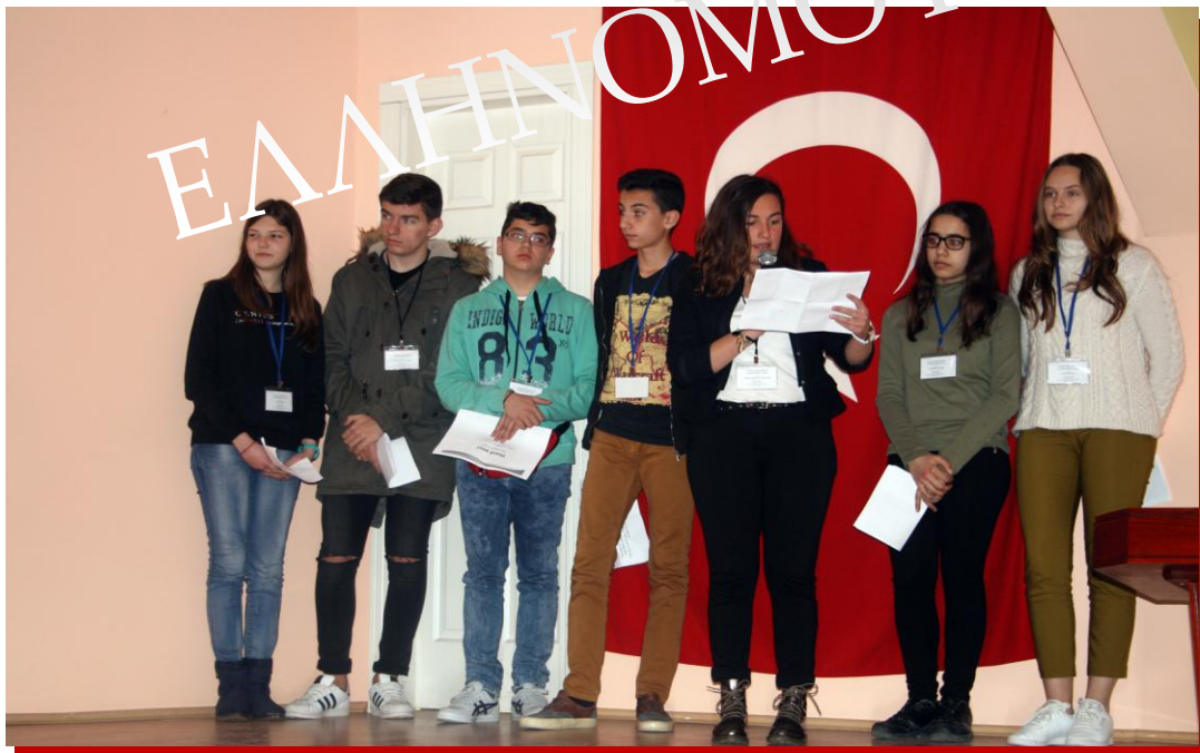
Η ομάδα παρουσίασης του 3 ου Γυμνασίου Αλεξανδρούπολης "Δόμνα Βισβίζη"