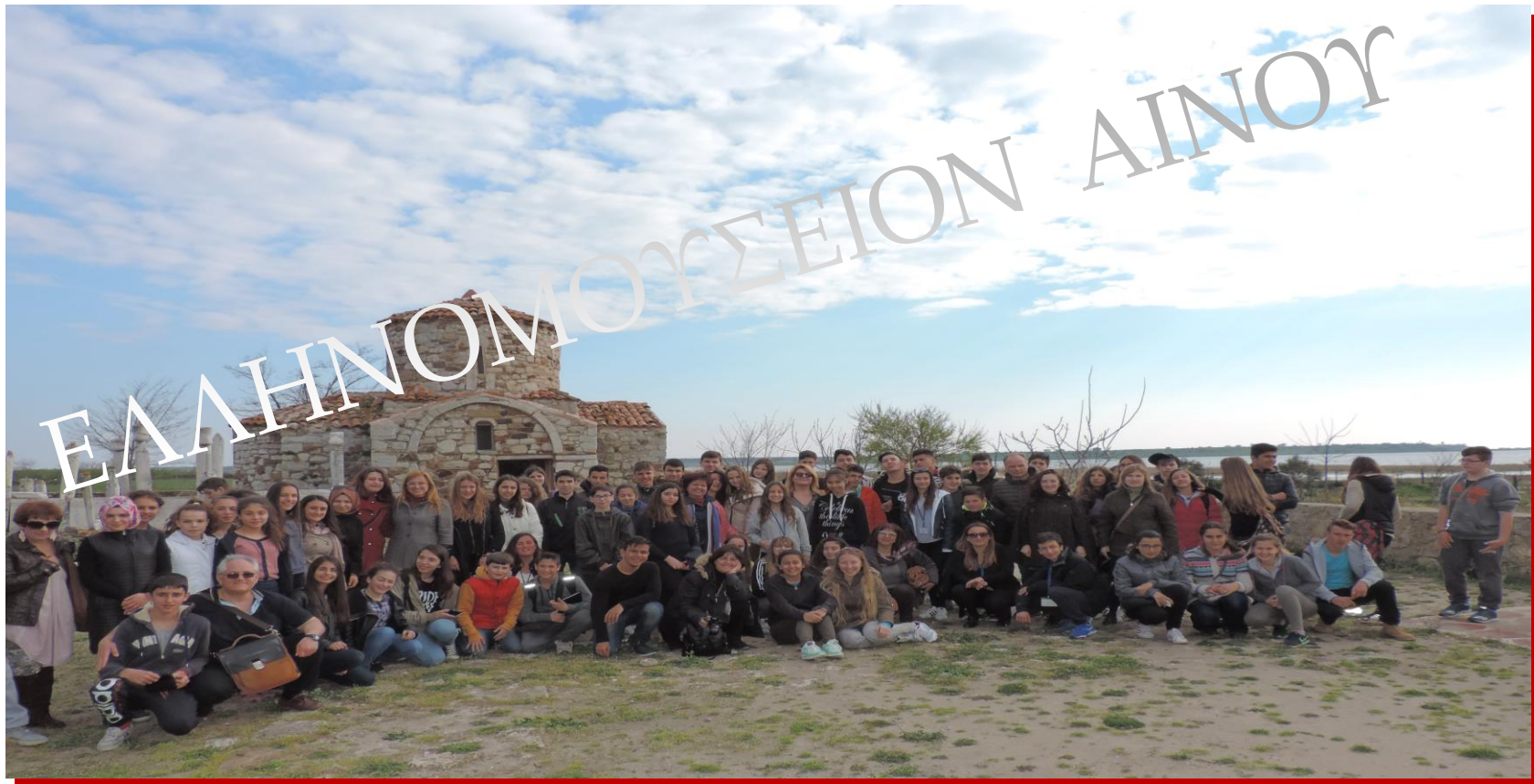
Άγιος Εύπλους – Αίνος, 28 Μαρτίου 2016

Πολιτιστικό πρόγραμμα «Ο Έβρος που ενώνει. Αίνος - Αλεξανδρούπολη» στο πλαίσιο διασχολικής συνεργασίας του 1ου Γυμνασίου Χαλανδρίου με το 3ο Γυμνάσιο Αλεξανδρούπολης «Δόμνα Βισβίζη» και με το Γυμνάσιο της Αίνου (Atatürk Orta Okulu).