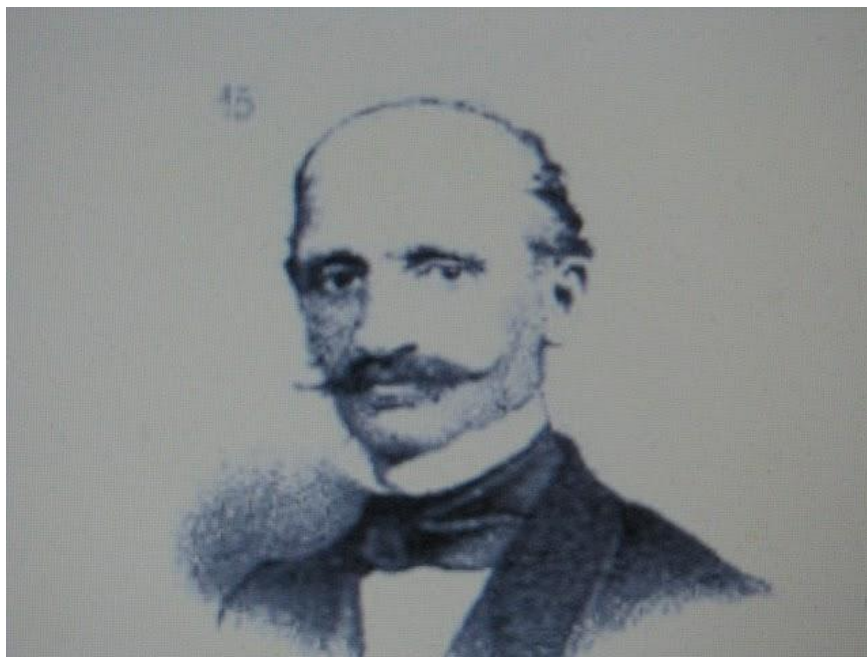
Ο Ιωάννης Δεληγιάννης

Οι κατατρεγμένοι Έλληνες της Αίνου, βλέποντας να μην γίνεται τίποτα και η άγρια καθημερινότητά τους να μην απαλύνεται, απευθύνθηκαν και στον Έλληνα πρεσβευτή στην Κωνσταντινούπολη Ιωάννη Δεληγιάννη με επιστολή τους την 1 η Ιουλίου 1868.