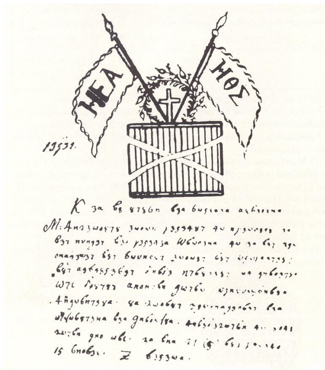
Δίπλωμα Φιλικής Έταιρείας του Άντ. Βισβίζη

Ο Αντώνης Βισβίζης γαλουχημένος με τα οράματα, τις παραδόσεις και τους θρύλους του Έθνους, υπήρξε από τους πρώτους που μνήθηκαν στην Φιλική Εταιρεία. Ο Καπετάν Βισβίζης με την ανδρεία, τον ηρωισμό και την αυτοθυσία του ενσαρκώνει τον Θράκα ναυτικό αγωνιστή της Επανάστασης του 1821 ο οποίος διέθεσε όλη την περιουσία του και τη ζωή του ακόμη για την Μεγάλη Ιδέα της Ελευθερίας του Έθνους.