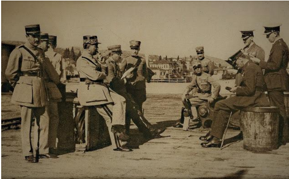
Οι αντιπρόσωποι των Μεγάλων Δυνάμεων στην παραλία των Μουδανιών