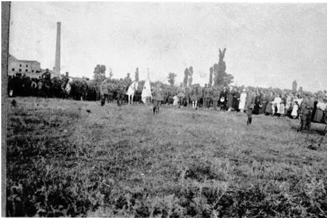
Ελληνικά στρατεύματα στο Σουφλί

αντιπροσώπου της στο εξωτερικό. Ο Βενιζέλος αποδέχθηκε την αντιπροσώπευση και ζήτησε με τηλεγράφημα πληροφορίες για τη στρατιωτική δύναμη, που μπορούσε να παρατάξει η Ελλάδα στη Θράκη, το διατιθέμενο υλικό, το ηθικό του στρατεύματος και το δημόσιο φρόνημα. Στις 18 Σεπτεμβρίου διαβιβάστηκαν στο Βενιζέλο οι πρώτες πληροφορίες, οι οποίες αναβίβαζαν το στρατό στη Θράκη σε 5 Μεραρχίες με συνολική δύναμη 45.000 άνδρες. Μέσα σε ένα μήνα η δύναμη θα ανερχόταν σε 80.000 άνδρες και μέχρι τέλους του Νοεμβρίου θα έφθανε τις 110.000 άνδρες. Υπήρχαν ελλείψεις σε υλικά, από τις οποίες οι σπουδαιότερες αφορούσαν πυρομαχικά όπλων Πεζικού και βλήματα ορειβατικού Πυροβολικού. Το ηθικό των ανδρών άρχισε να αναπτερώνεται.