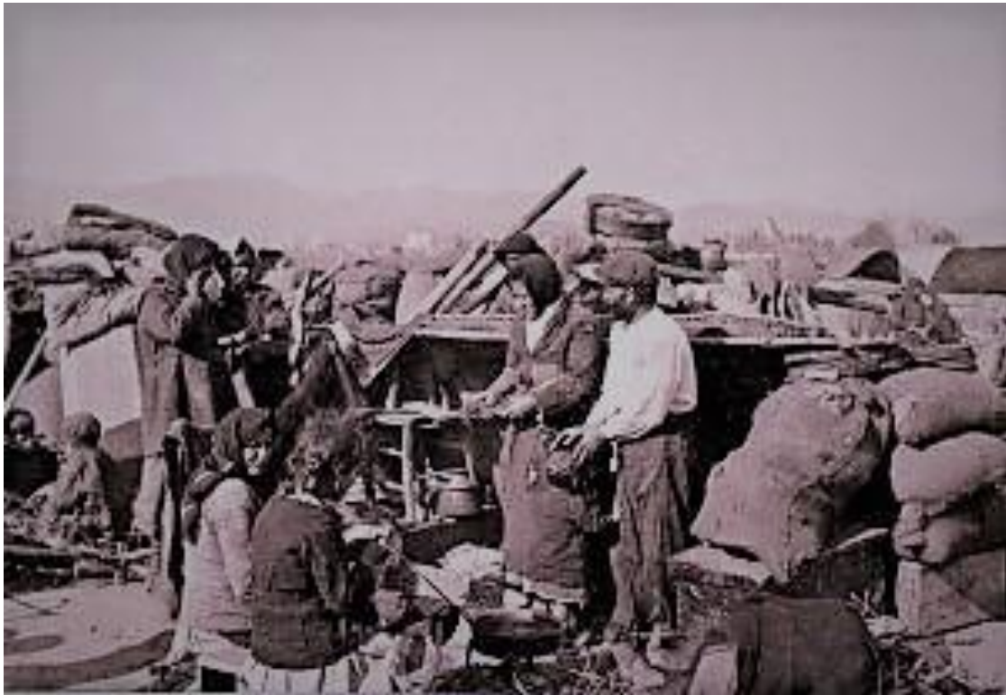
Η δραματική εκκένωση της Ανατολικής Θράκης

Ο Κεμάλ απάντησε καταφατικά στο διάβημα και όρισε ως αντιπρόσωπο στις διαπραγματεύσεις των Μουδανιών το Διοικητή του Δυτικού Τουρκικού Μετώπου Στρατηγό Ισμέτ Πασά (Ινονού). Η Αθήνα στο μεταξύ είχε σχεδόν εντελώς αγνοηθεί. Η Επαναστατική Κυβέρνηση, εκτός από προειδοποίηση που διαβιβάσθηκε από τον Ύπατο Αρμοστή στην Κωνσταντινούπολη, κανένα άλλο επίσημο συμμαχικό μήνυμα δεν είχε πάρει σχετικά με τη σύσκεψη των Μουδανιών. Τη τελευταία στιγμή ο Πρεσβευτής της Μεγάλης Βρετανίας ενημέρωσε την Κυβέρνηση. Ύστερα από αυτό αποφασίσθηκε η αποστολή στα Μουδανιά αντιπροσωπείας με επικεφαλής τον Υποστράτηγο Αλέξανδρο Μαζαράκη, στον οποίο καθορίσθηκε από το Υπουργικό Συμβούλιο ότι: «Σκοπός της συσκέψεως των Μουδανιών ήτο ο καθορισμός της γραμμής εις την οποίαν ενδεχομένως θα ήτο δυνατόν να υποχωρήσουν τα Ελληνικά Στρατεύματα, προ της ενάρξεως της Συσκέψεως της οριστικής ειρήνης» . Για την εκπλήρωση της παραπάνω εντολής οι οδηγίες της Ελληνικής Κυβέρνησης προς την αντιπροσωπεία ήταν ότι δεν θα δεχόταν εγκατάλειψη της Ανατολικής Θράκης. Μόνο τροποποιήσεις της ήδη κατεχόμενης γραμμής θα ήταν δυνατόν να δεχθεί.